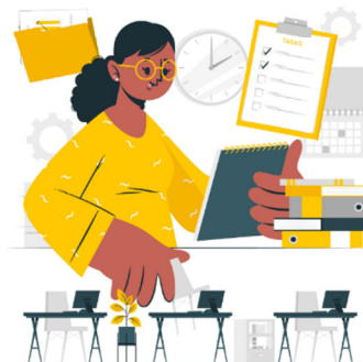
Ilustración 6 Evaluación del Respeto