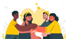
Ilustración 4 Sección Respeto