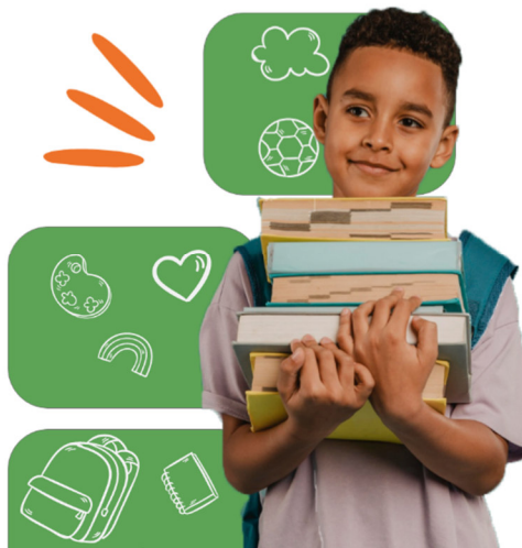
Ilustración 2 Pantalla de Inicio