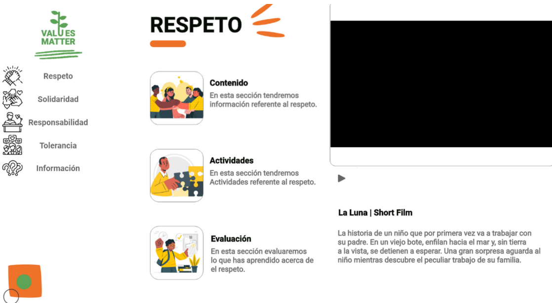
Ilustración 3 Contenido del Respeto