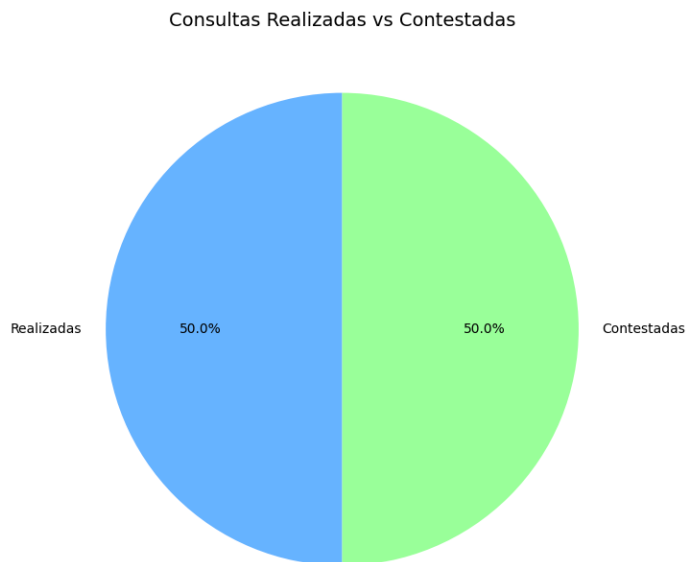
Figura 1 Consultas realizadas vs contestadas