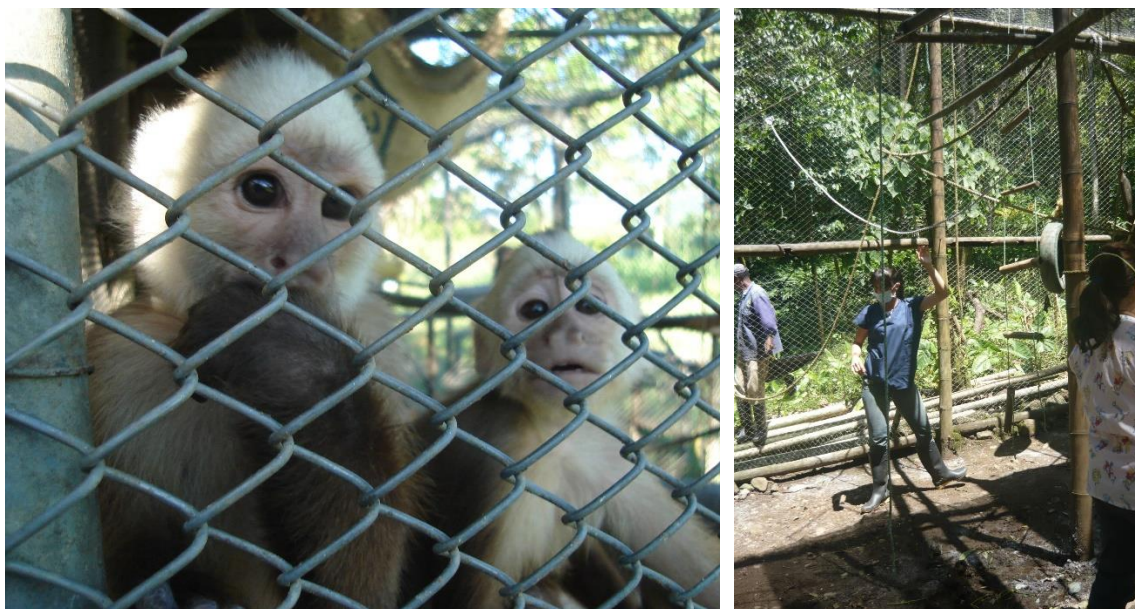
Fotografía 1. Jaulas para primates de la genero Cebus Tomada por: Mary Cerliz Choperena.

puntiagudos para que no se lastimen los animales. (Ministerio de agricultura de Chile, 2014). La estructura ideal es que sea grande y espaciosa que, según algunos autores, pueden medir entre 18 x 4 x 4m, 6 x 6m, 5 x 5m (Aprile y Bertonatti, 1996; Pérez, 2005; Márquez et al., 2014). Otros autores recomiendan que específicamente para los primates del género Cebus la infraestructura sea de 4m de ancho x 2.5 de largo x 2.5 de alto, esto para un grupo de 5 animales (Ortiz, 2003) Fotografía 1.