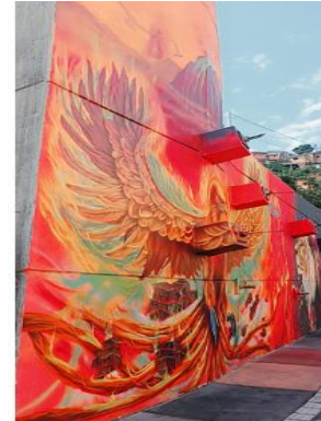
Vista panorámica de la Comuna 13