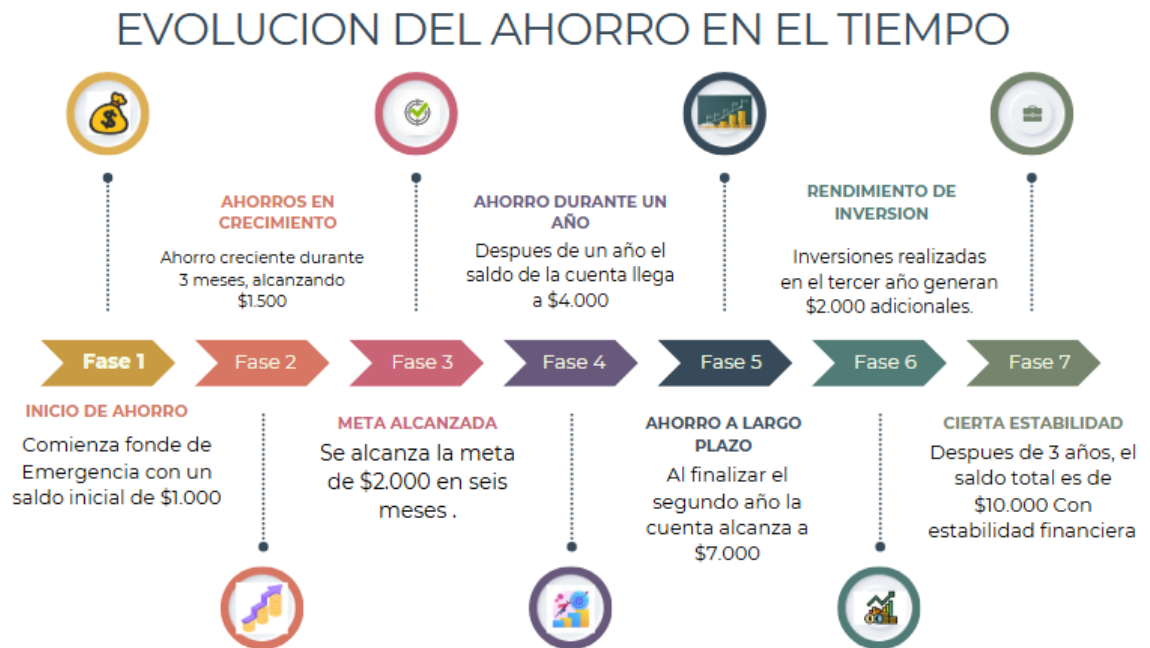
Figura 3. Evolución del ahorro en el tiempo.