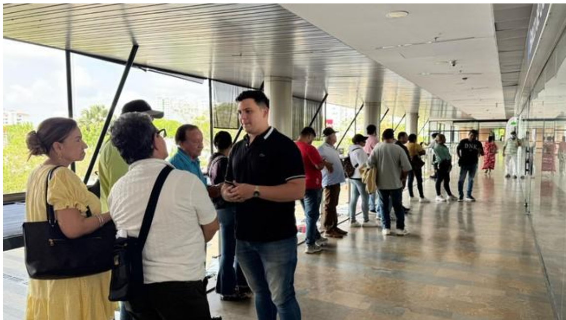
Concientización del pago del Impuesto Vehicular.

En total para la vigencia del año 2024, el recaudo del impuesto vehicular fue de 34 mil 144 millones, de los cuales 7 mil 649 millones fueron producto de los descuentos otorgados del 80% en interés y sanciones.