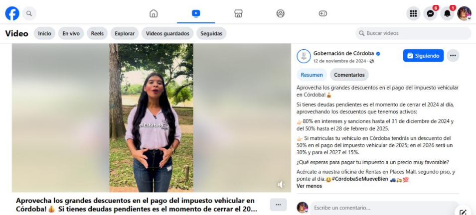
Campaña de descuentos vía Facebook, página de la Gobernación de Córdoba.