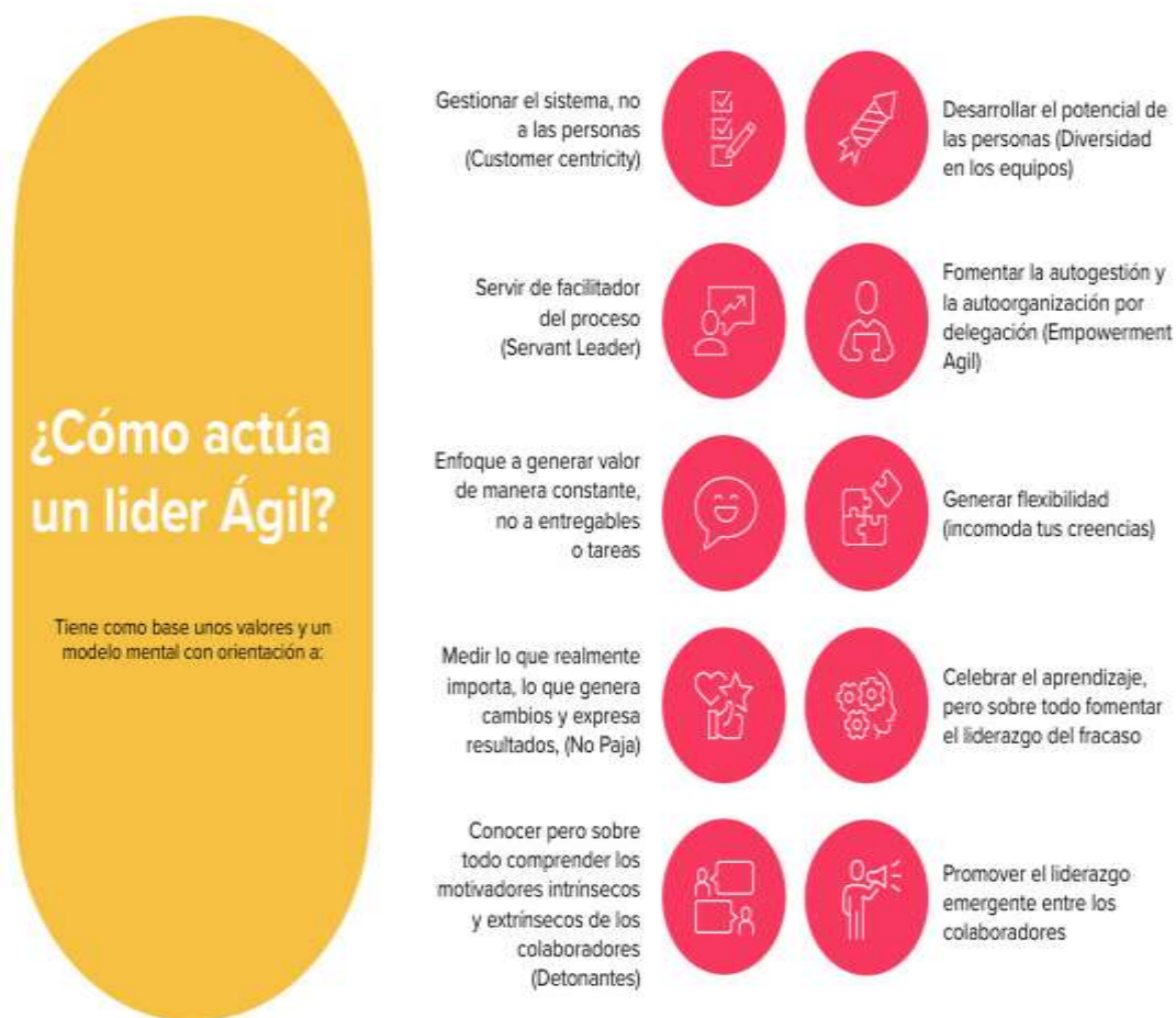
Gráfico 1. ¿Cómo actúa un líder ágil?