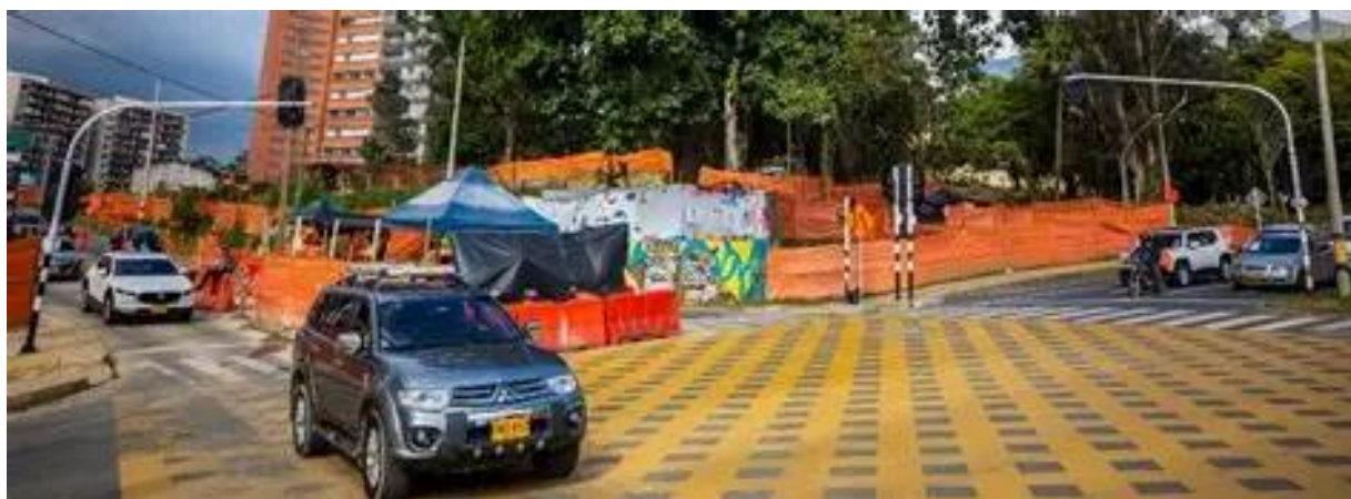
Imagen 2. obra valorización en el poblado