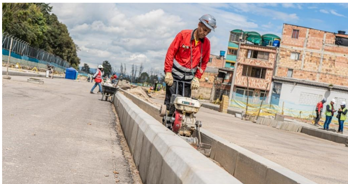
Imagen Avenida José Celestino Mutis