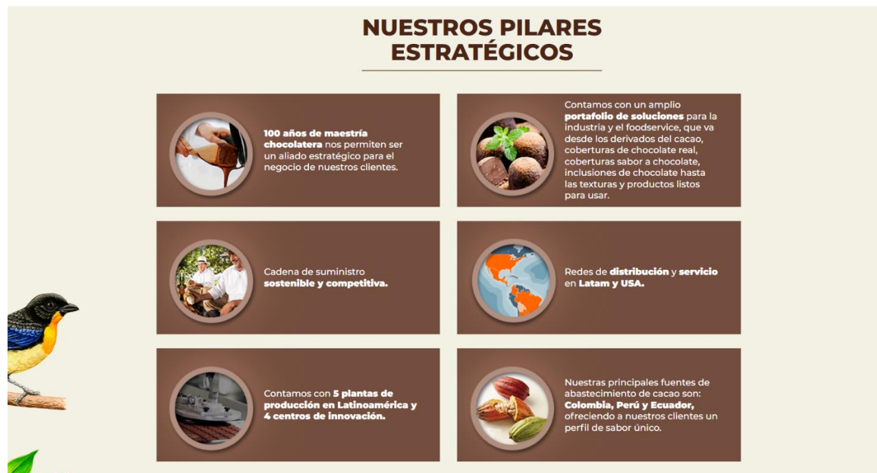
Figura 1. Pilares estratégicos Nacional de Chocolates.

A continuación, podemos ver como la empresa Nacional de Chocolates cuenta con unos pilares estratégicos lo cuales le permiten todos los días ser una empresa ágil y competitiva en el mercado: