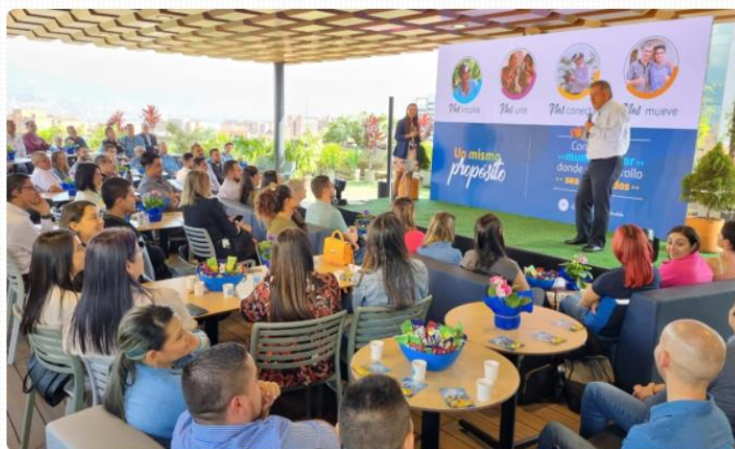
Figura 2. Todo el personal administrativo y operativo unidos al mismo propósito.

Conocer prácticas para que nosotros y quienes nos rodean vivamos más conectados con la vida. Tomar herramientas para que el mundo sea un mejor lugar. Construir e interiorizar nuestro propósito de vida y cómo conectarlo con el propósito de nuestro Negocio Chocolates y de Grupo Nutresa. Generar conciencia del bien colateral que generamos con las personas que nos rodean a partir de nuestro propósito de vida.