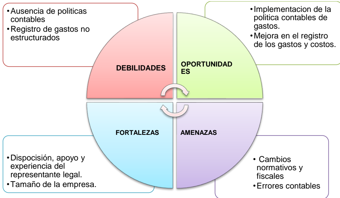
Figura 2. Matriz Dofa de la empresa full asistencias exequiales sas