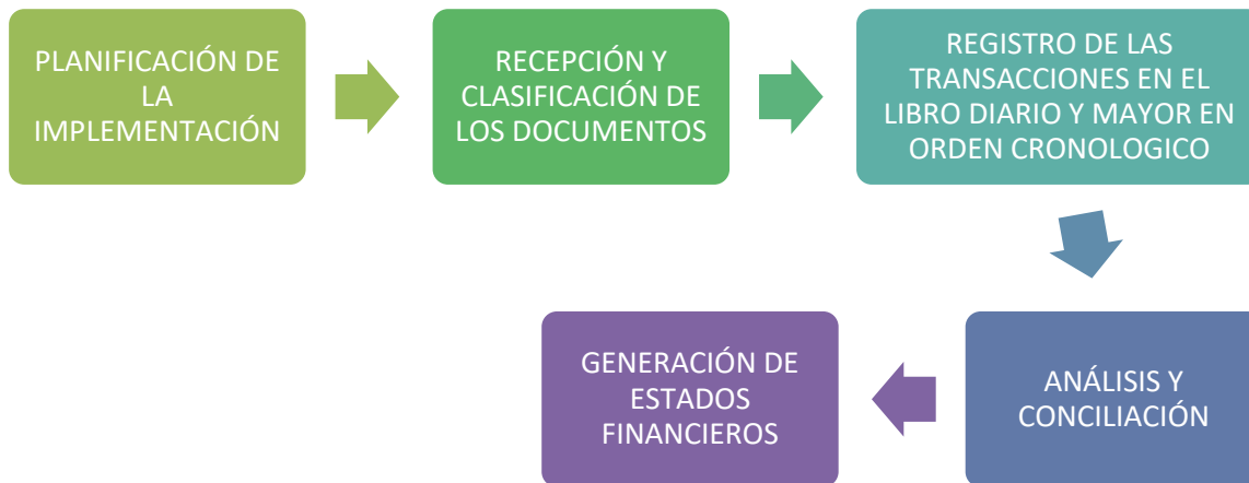
Figura 3. Proceso contable de la empresa full asistencias exequiales sas

El conocimiento de los procedimientos y procesos contables adecuados, tiene gran importancia ya que logra tener un buen control de las actividades realizadas dentro y fuera de la empresa. se pueden registrar las operaciones contables, se recompilan de manera ordenada todas las operaciones a cargo de cada uno de los puestos de trabajo facilitando su control, aumentan la eficiencia de los empleados al momento de presentar resultados de su gestión y puede ser utilizado en el mejoramiento de las actividades de la organización. Por lo cual se desarrolló el proceso contable de la empresa FULL ASISTENCIAS EXEQUIALES S.A.S