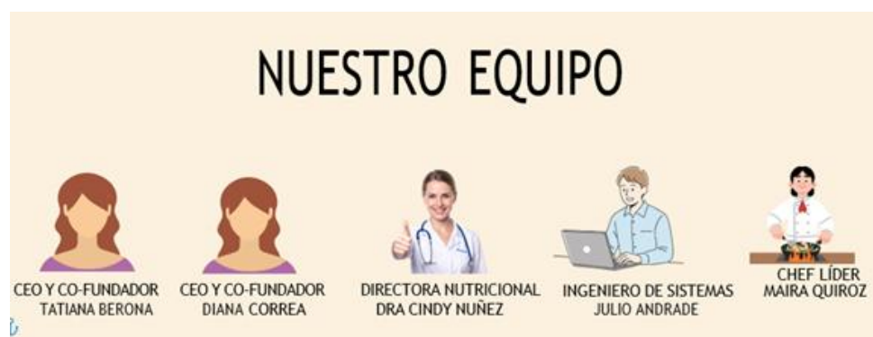
Figura 3.. Equipo encargado de la app “Sazón en Vivo”.