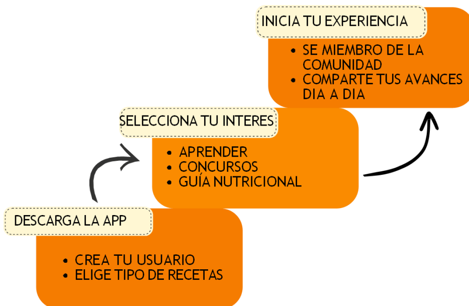
Figura 2. Funcionamiento de la app “Sazón en Vivo”

La propuesta y funcionamiento de la aplicación “sazón en vivo” se centra en todas las opciones que puede tener el usuario desde el momento en que descarga la app, selecciona lo que más le interesa e inicia la experiencia de cocinar en vivo, como lo indica la siguiente imagen: