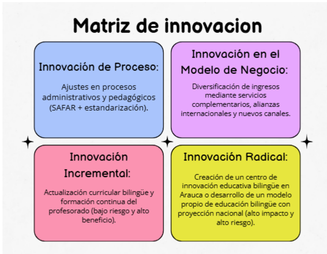
Figura 3: Nota. Adaptado de Matriz de Innovación/Ambición elaborada para este trabajo a partir de Nagji y Tuff (2012) y del Proyecto Educativo Institucional del Colegio Bilingüe Finlandés (2021).

https://www.canva.com/design/DAG0F-WcKn4/KzG7jyH1q2wuiNI7LS-8rg/edit?utm_content=DAG0F-