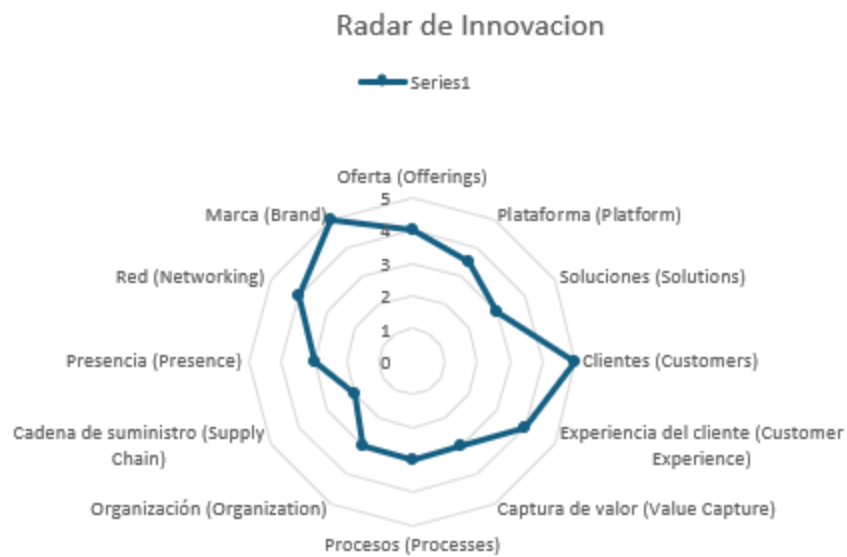
Figura 2 : Nota. El Radar de Innovación fue elaborado para este trabajo con base en el Proyecto Educativo Institucional del Colegio Bilingüe Finlandés (2021) y en la metodología de Doblin (2018), adaptando doce dimensiones (Oferta, Plataforma, Soluciones, Clientes, Experiencia del cliente, Captura de valor, Procesos, Organización, Cadena de suministro, Presencia, Red y Marca) al contexto de la gestión estratégica de la innovación organizacional.