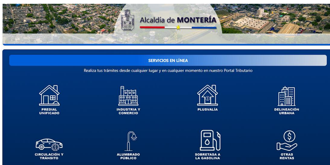
Ilustración 5. Impuestos que se gestionan en Taxation Smart

Se demuestra que la plataforma permite gestionar varios impuestos territoriales, entre los cuales sobresalen el Impuesto Predial Unificado, el Impuesto de Industria y