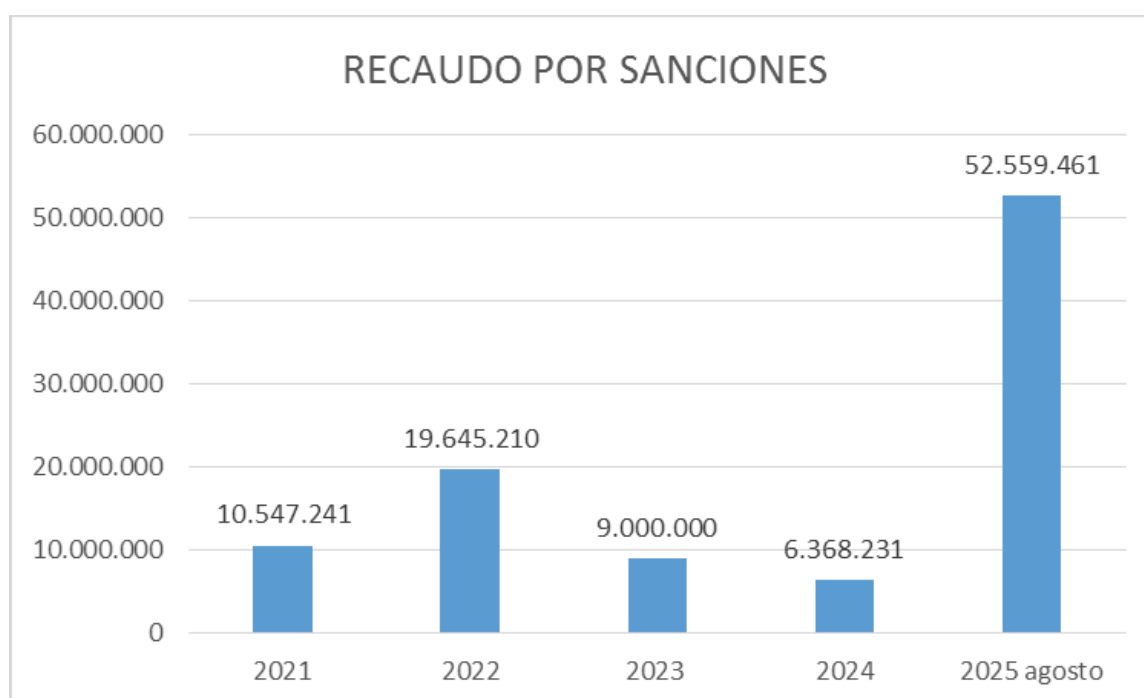
Tabla 5.