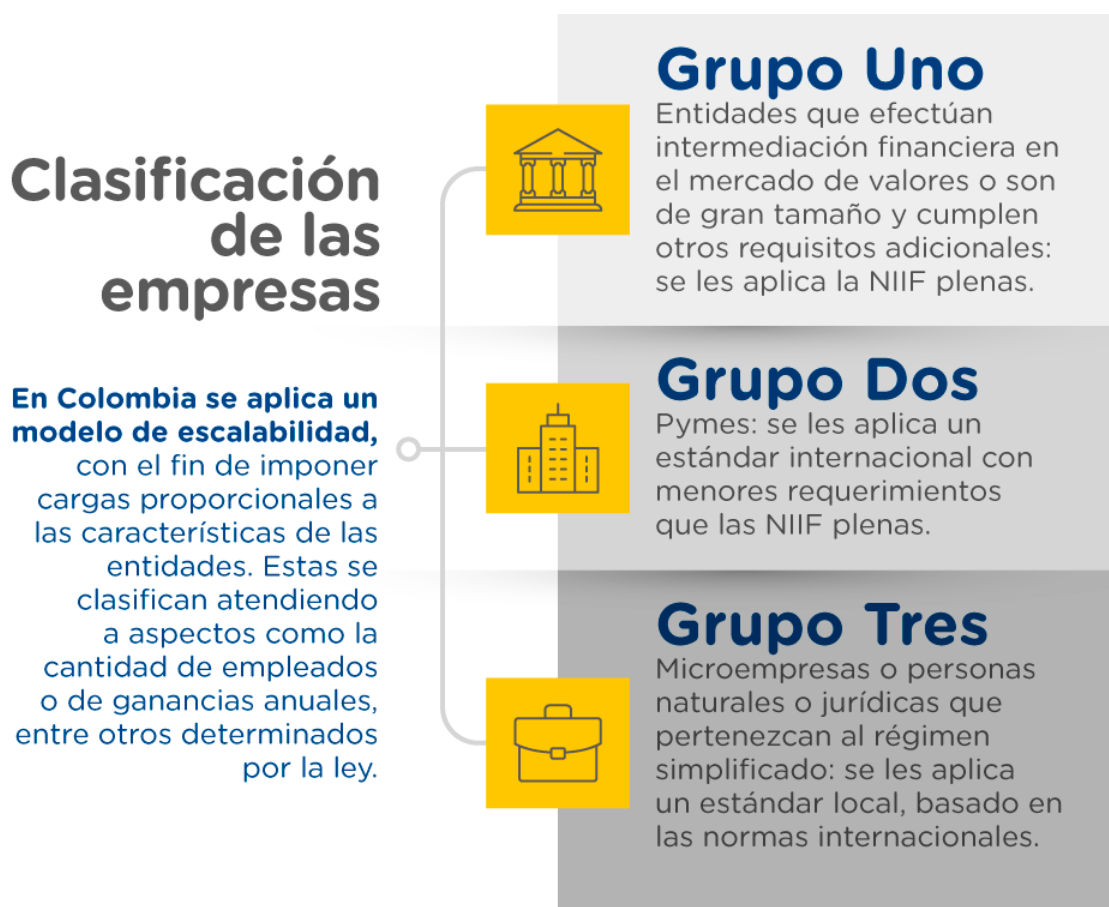
Tabla 1. Clasificación de las empresas en Colombia