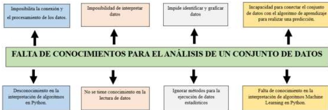
Ilustración 1: Árbol del problema.