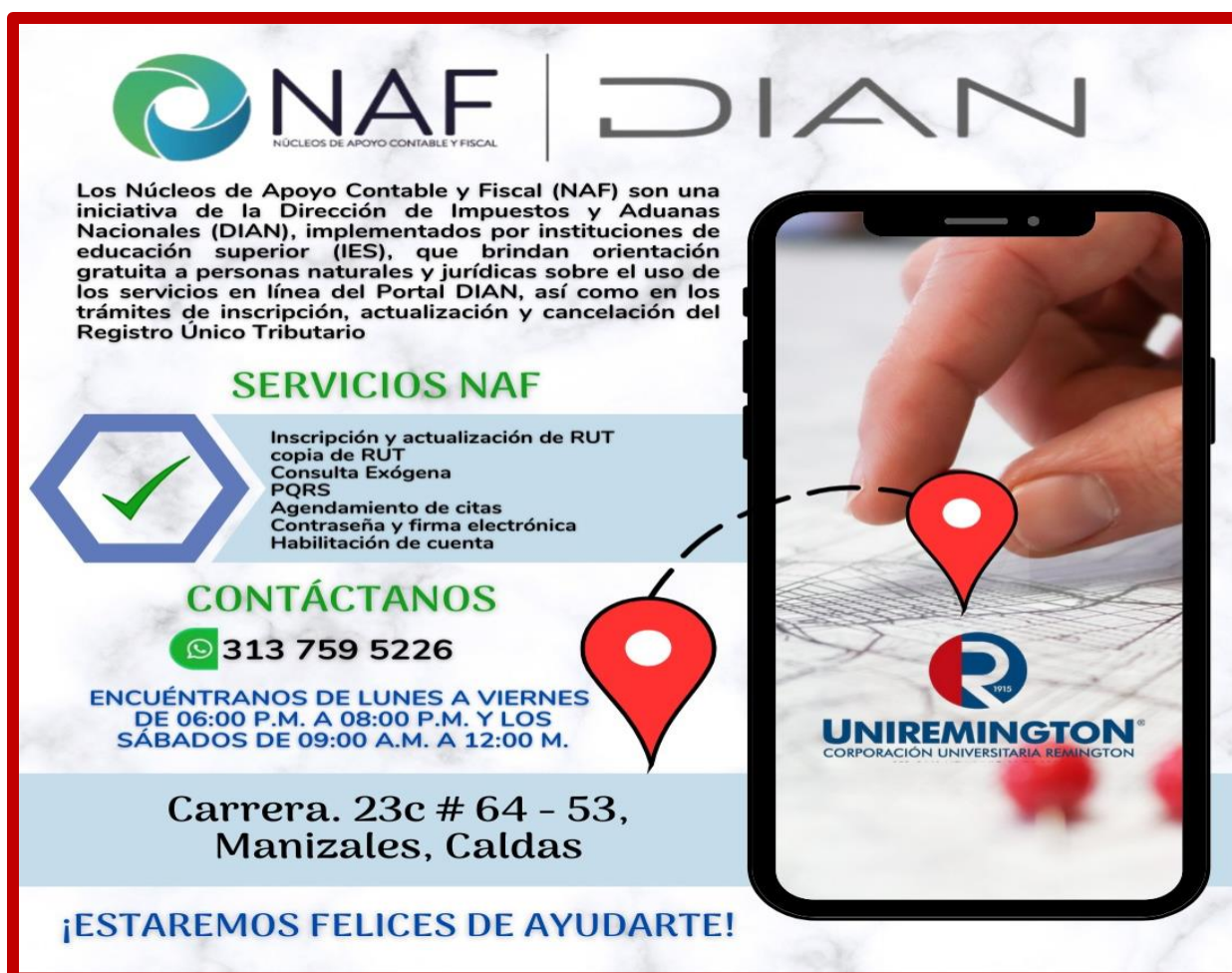
Figura 3. Propaganda Servicios Ofrecidos por el Consultorio NAF.

La implementación de la práctica en el consultorio NAF representó una experiencia de gran valor académico y profesional, permitiendo el desarrollo de competencias clave en el ámbito contable y fiscal. A lo largo de las sesiones de asesoramiento, se logró fortalecer el conocimiento de los estudiantes en la aplicabilidad del Registro Único Tributario (RUT) y en la gestión de trámites tributarios esenciales, lo que resultó en una contribución significativa al entendimiento de los contribuyentes sobre sus obligaciones fiscales.