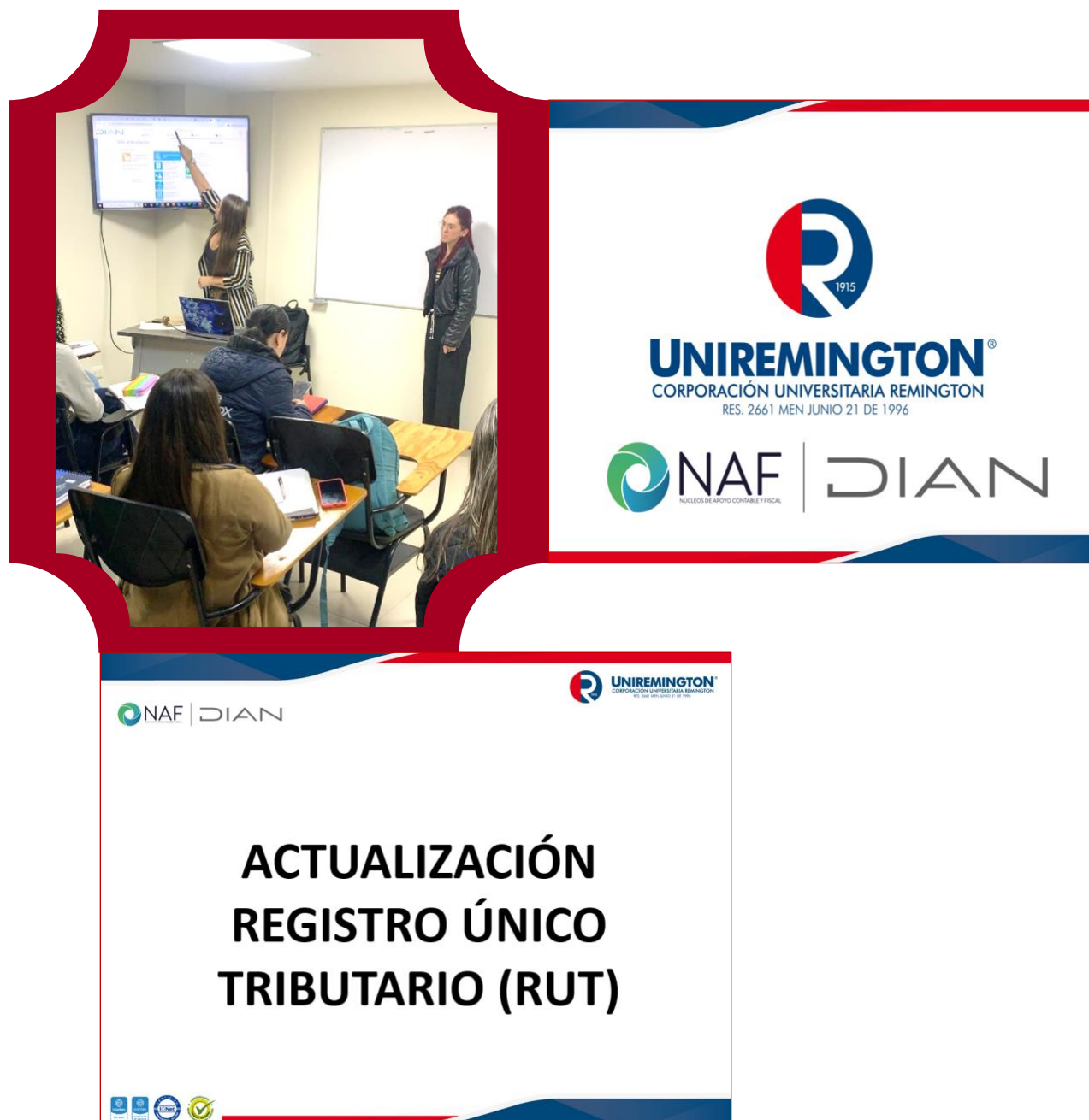
Figura 2. Capacitación sobre actualización del RUT y Navegación por el Portal Dian