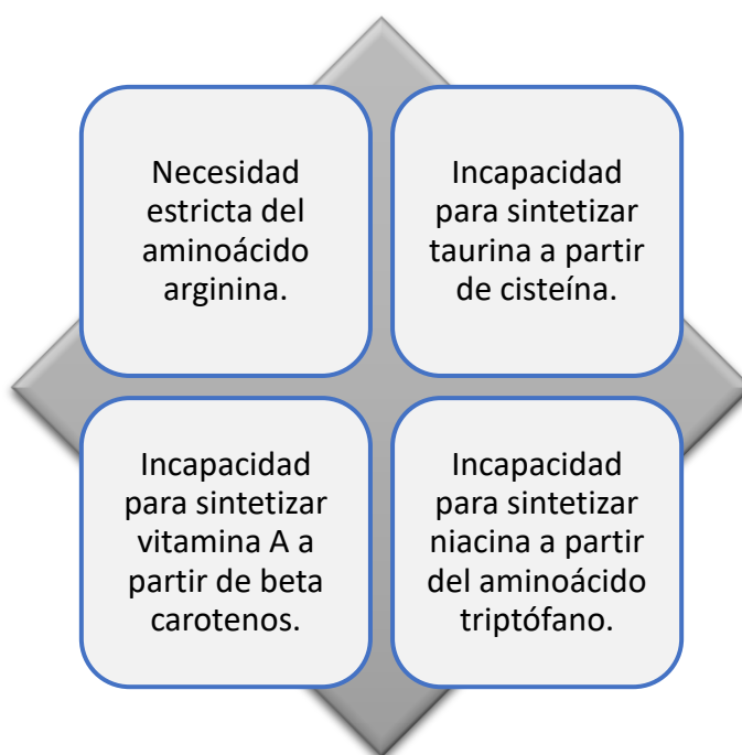
Figura 2. Aspectos metabólicos particulares en el gato.

Además, existen otros aspectos específicos en el metabolismo de los gatos, los cuales están representados en la figura 2 y, al igual que los mencionados previamente, tienen una gran importancia.