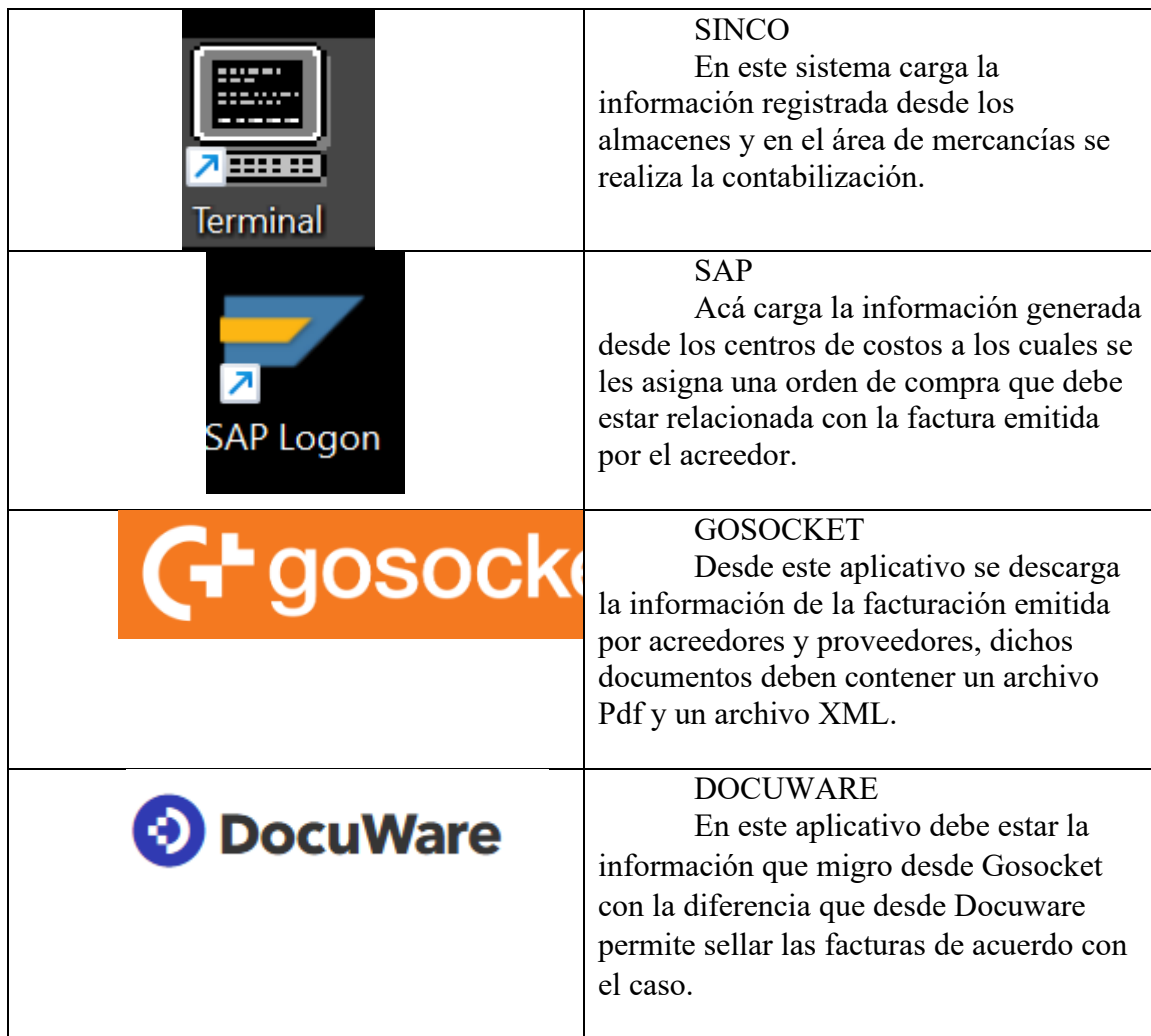
Tabla 2 Aplicativos utilizados