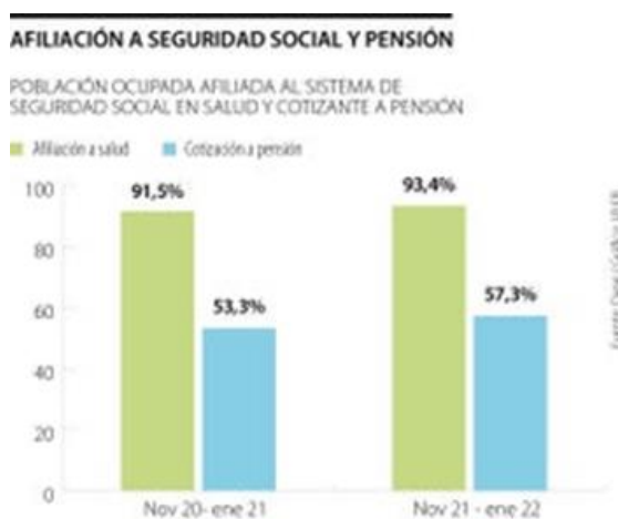
Ilustración 1 Porcentajes de Afiliación a Seguridad Social Colombia 2020-2021

En términos generales y como lo establece la página web del Ministerio de Salud, la afiliación de los trabajadores ha crecido en cobertura pasando de un 29,21% a casi un 99% a diciembre del año 2022. Lo anterior es resultado de las políticas del gobierno considerando el crecimiento de la población económicamente activa del país. Lo anterior se evidencia en las siguientes ilustraciones.