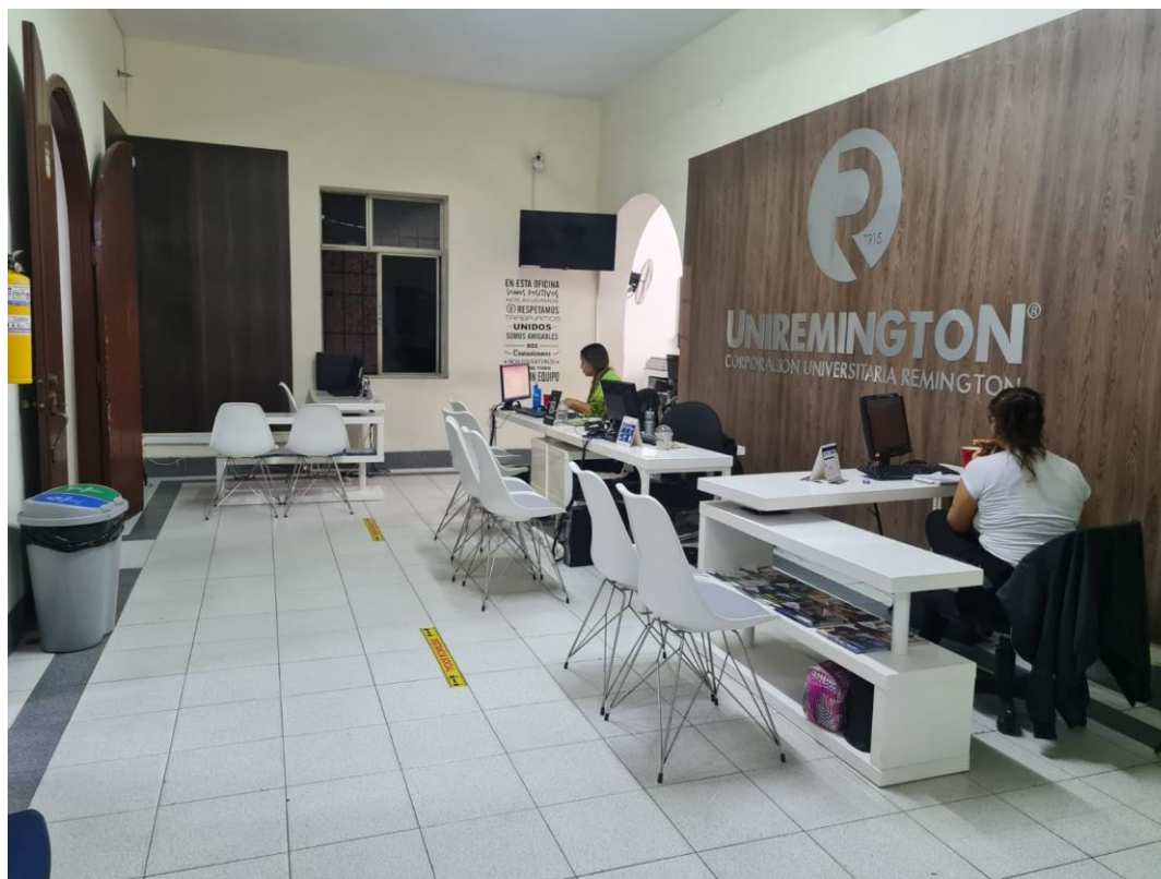
Figura 3. Entrada principal Universidad Remington Sede de Cali