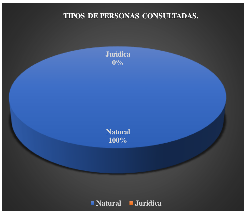
Grafica circular 1. Tipos de personas consultadas.